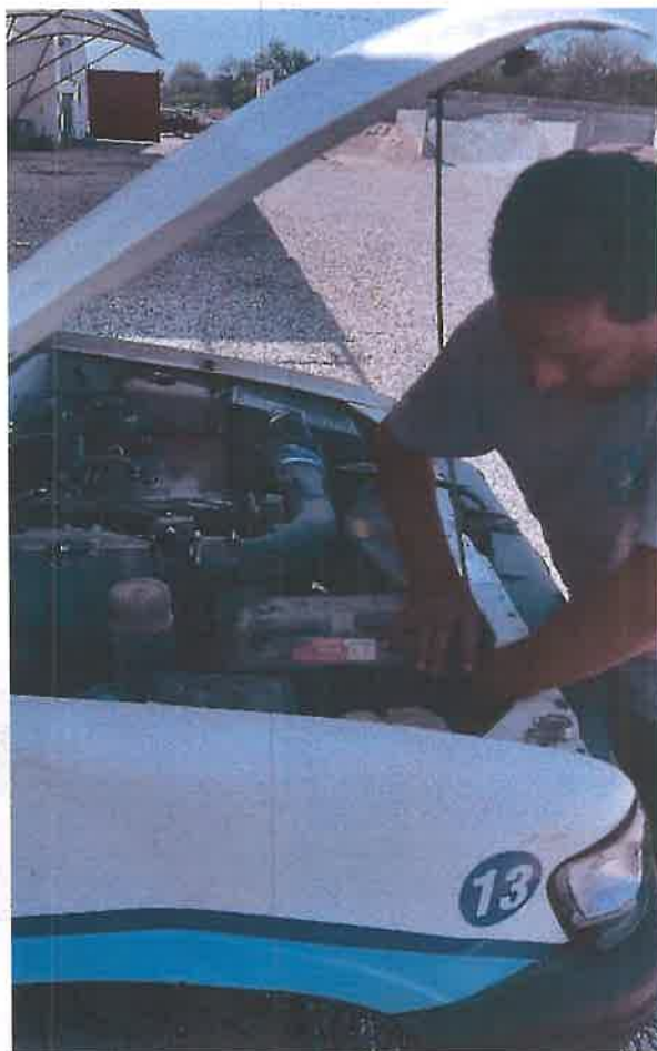
Mantenimiento menor de vehículos.