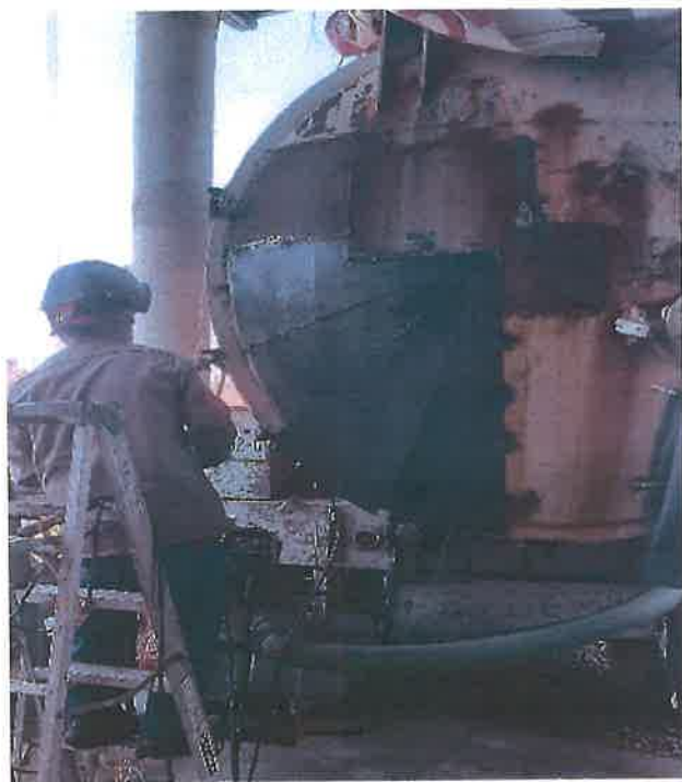
Mantenimiento del camión Vector para desazolvé.