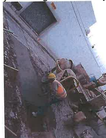
Reposición de pavimento de concreto hidráulico

Durante el ejercicio Fiscal 2023 se instalaron 431 tomas nuevas, incrementando así el Padrón de Usuarios a 25 590, así mismo se cambiaron 662 medidores en diferentes calles de la cabecera municipal, debido a que ya eran obsoletos y con deficiencias en la medición del consumo de agua potable. También se continua con la reposición de banquetas y pavimento de concreto hidráulico derivado de las reparaciones y mantenimiento de las líneas de agua y drenaje, así como de la instalación de nuevas tomas de agua y descargas de drenaje.