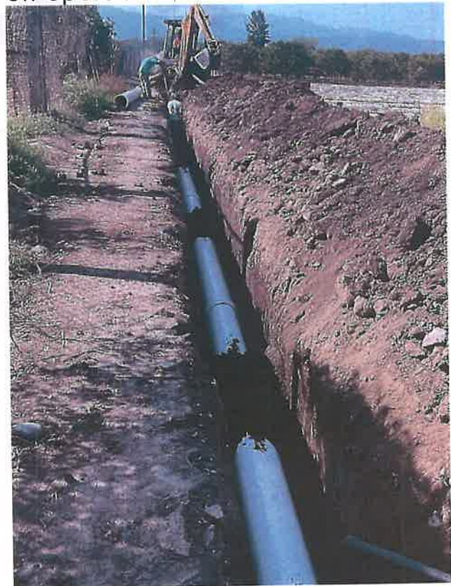
Línea de agua potable Pozo 9.