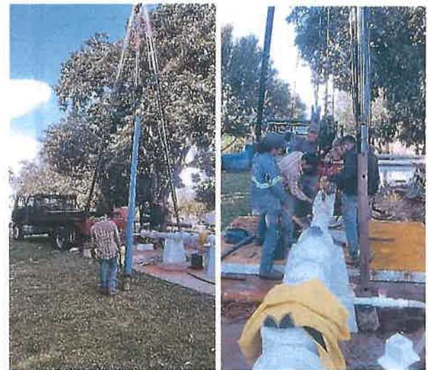
Pozo 10 cambio equipo de bombeo.

Se dio mantenimiento a las varias fuentes de abastecimiento de agua con las que cuenta el organismo para el suministro del servicio, en el pozo 16 se realizó el cambio del equipo de bombeo, de igual manera en el pozo 10 también se realizó el cambio del equipo de bombeo, estos pozos abastecen la cabecera municipal; en pozo la Noria que atiende la comunidad de Pastora se cambió equipo de bombeo y parte de la tubería de la columna del pozo, así como también el Tanque de San Juan, Paso de San Antonio cambiando los equipos de bombeo.