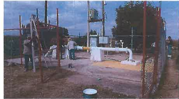
Cerco perimetral y tren de descarga en pozo.

Se rehabilitaron los trenes de descarga, así como los cercos perimetrales de los pozos y se dio mantenimiento preventivo a los arrancadores y subestaciones de servicio.