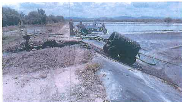
Extracción de lodos digeridos, laguna anaerobia PTAR.

Se extrajeron lodos digeridos de las lagunas anaerobias de la PTAR.