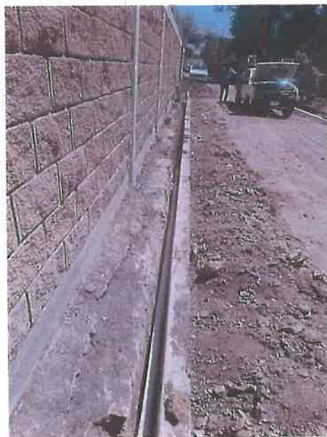
Línea de agua potable Tierras Blancas.

También se realizó la introducción de línea de agua potable en Tierras Blancas, del Ejido Puente del Carmen