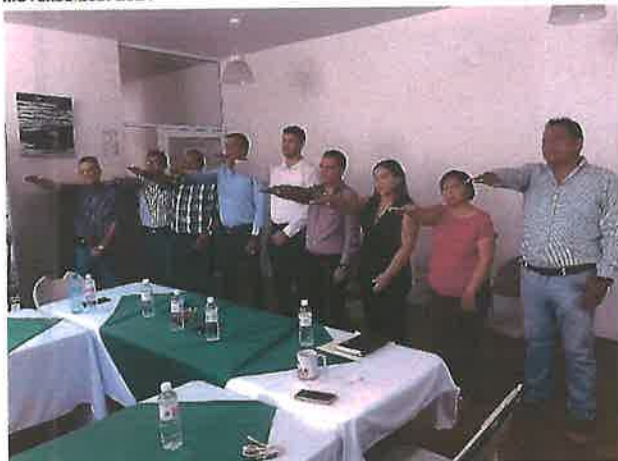
Toma de protesta a nuevos integrantes del Consejo Consultivo.

Se les hace entrega de uniformes para el personal operativo y administrativo del organismo y así coadyuvar a un mejor desempeño de sus funciones lo cual redundara de manera significativa en su desempeño, contribuyendo de manera fundamental en la cosecha de mejores resultados.