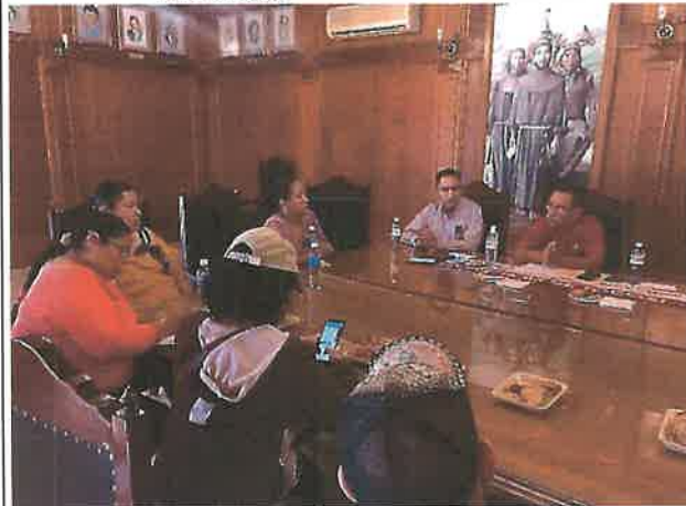
Entrevista en Cabildo con medios de comunicación