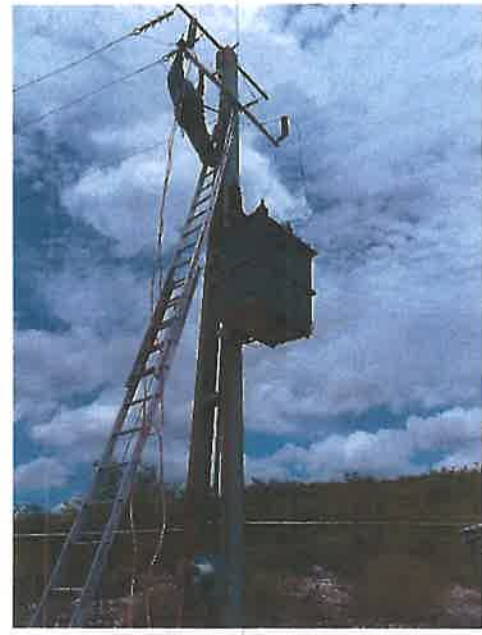
Transformador pozo San Rafaelito.

Se rehabilitaron los trenes de descarga, así como los cercos perimetrales de los pozos y se dio mantenimiento preventivo a los arrancadores y subestaciones de servicio.