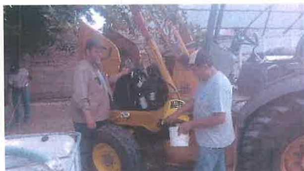
Mantenimiento menor de maquinaria