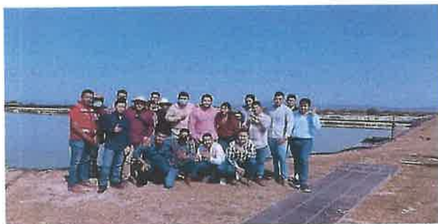
Visita estudiantes Universidad de Morelia, Michoacán.

Se extrajeron lodos digeridos de las lagunas anaerobias de la PTAR.