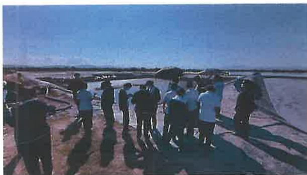
Visita estudiantes Enfermería UASLP UZM.

De igual manera se da mantenimiento a las áreas verdes de la PTAR teniendo espacios limpios y libres de fauna nociva. Esto como parte de la eficiencia en la operatividad de la misma y por las constantes visitas de planteles educativos de nivel profesional.