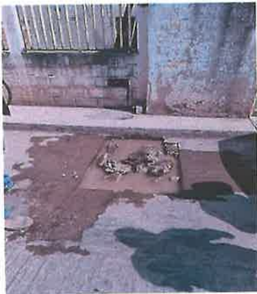
Atención de fugas de Agua Potable

En este segundo año de actividades se sigue dando atención de primer nivel y atendiendo los reportes de fugas a la brevedad para una mejor eficiencia del servicio