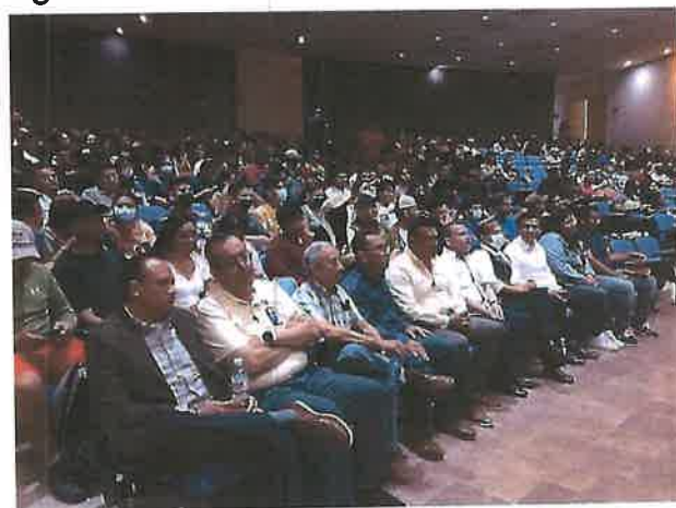
Evento del día mundial del agua en la UASLP ZM.

Se llevo a cabo el evento del día mundial del agua realizando diferentes actividades, pero resaltando siempre la importancia de este recurso no renovable pero vital para el desarrollo y la supervivencia de la población, resaltando siempre el interés de nuestro presidente municipal por el cuidado del agua.