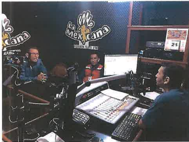
Entrevista en radio.

Como sabemos el flujo del agua muchas veces parece incierto, tanto por causas naturales como por causas de la infraestructura existente; por lo que en el organismo siempre trata de prevenir inconvenientes para los usuarios. Así que siempre se trata de anticipar y dar avisos o comunicados a la población ya sea mediante boletines informativos, conferencias de prensa o a través de las redes sociales.