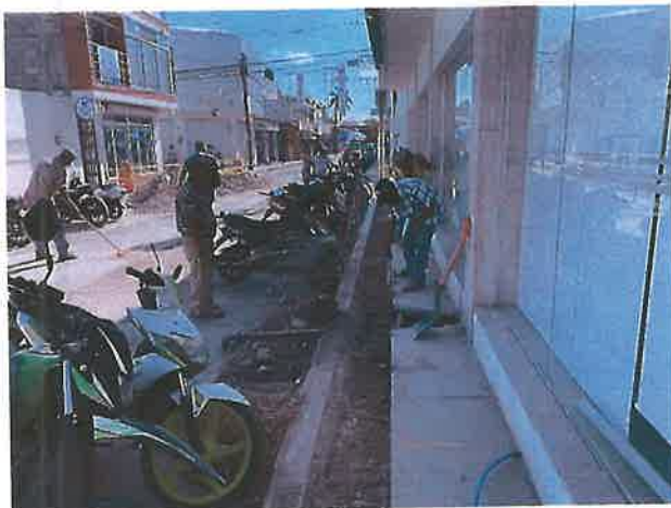
Calle Gabriel Martínez.