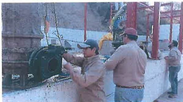
Cárcamo de bombeo PTAR.

De igual manera se da mantenimiento a las áreas verdes de la PTAR teniendo espacios limpios y libres de fauna nociva. Esto como parte de la eficiencia en la operatividad de la misma y por las constantes visitas de planteles educativos de nivel profesional.