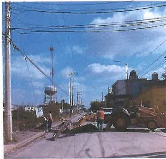
Instalación de Toma de Agua y Descarga de Drenaje

Durante el ejercicio Fiscal 2023 se instalaron 431 tomas nuevas, incrementando así el Padrón de Usuarios a 25 590, así mismo se cambiaron 662 medidores en diferentes calles de la cabecera municipal, debido a que ya eran obsoletos y con deficiencias en la medición del consumo de agua potable. También se continua con la reposición de banquetas y pavimento de concreto hidráulico derivado de las reparaciones y mantenimiento de las líneas de agua y drenaje, así como de la instalación de nuevas tomas de agua y descargas de drenaje.