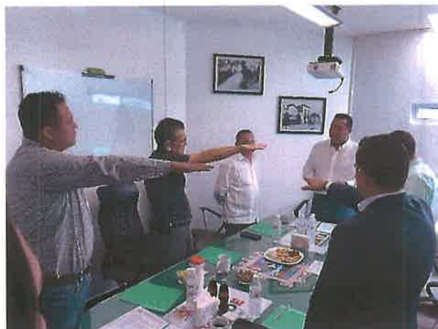
Toma de protesta a nuevos integrantes de la Junta de Gobierno.

Los integrantes de esta Junta, así como también el Regidor del H. Ayuntamiento encargado de la Comisión del Agua, han contribuido de manera invaluable en esta tarea.