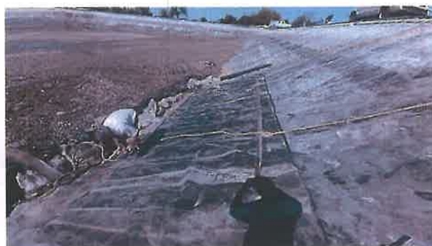
Rehabilitación de geomembrana, laguna anaerobia PTAR.

Así mismo se realizó la reparación de la geomembrana dañada en varias partes de las lagunas anaerobias, incluido el mantenimiento del pretratamiento y cárcamo de bombeo.