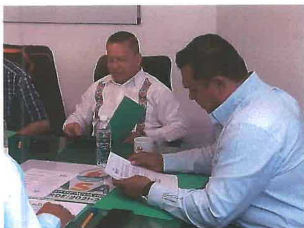
Reuniones de la Junta de Gobierno.

Se trata de conservar el equipo y maquinaria en condiciones óptimas para así dar una respuesta rápida a las necesidades del organismo y de los usuarios, ya que como sabemos el funcionamiento y la operatividad del organismo dependen de la recaudación.