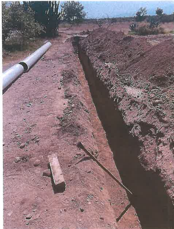
Línea de agua potable Pozo 3.

* Rehabilitación de línea de agua potable pozo 3.