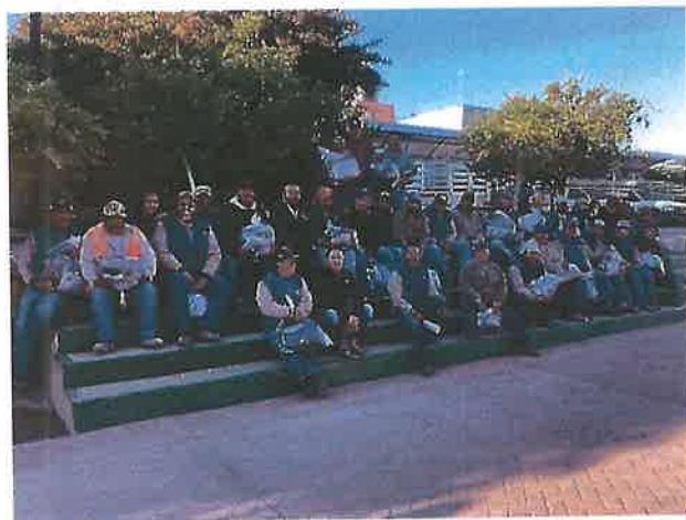
Entrega de uniformes para el personal operativo y administrativo.

Se les hace entrega de uniformes para el personal operativo y administrativo del organismo y así coadyuvar a un mejor desempeño de sus funciones lo cual redundara de manera significativa en su desempeño, contribuyendo de manera fundamental en la cosecha de mejores resultados.