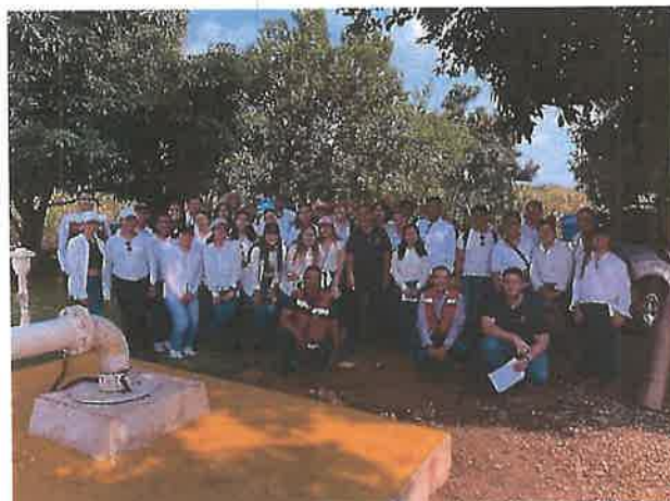
Visita de estudiantes de la Universidad de Zacatecas.

Dentro de los diferentes planteles solicitantes se tuvo una visita guiada de estudiantes de la UAZ a la PTAR, al cárcamo de bombeo y a la zona de pozos.