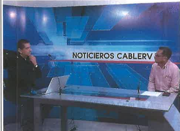
Entrevista a directivos en Cable RV

Y la VISIÓN de trabajar, brindando capacitación en tecnología de vanguardia, transparencia y sustentabilidad, supervisando la correcta aplicación de los recursos tanto materiales como humanos con que cuenta el organismo operador.