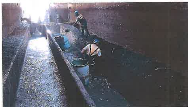
Mantenimiento del sistema de pretratamiento en cárcamo de bombeo, PTAR.

SASAR ORGANISMO DE AGUA POTABLE RIOVERDE 2021-2024 COMISIÓN GENERAL